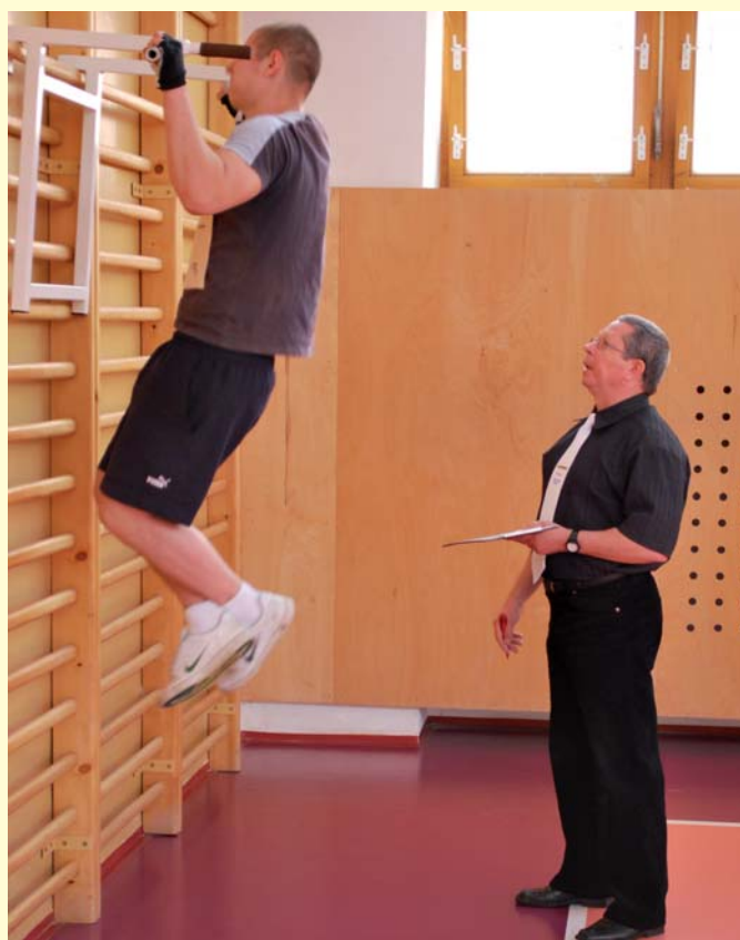
V silovom päťboji si najlepšie počínali chlapci z SOŠ Holíč.