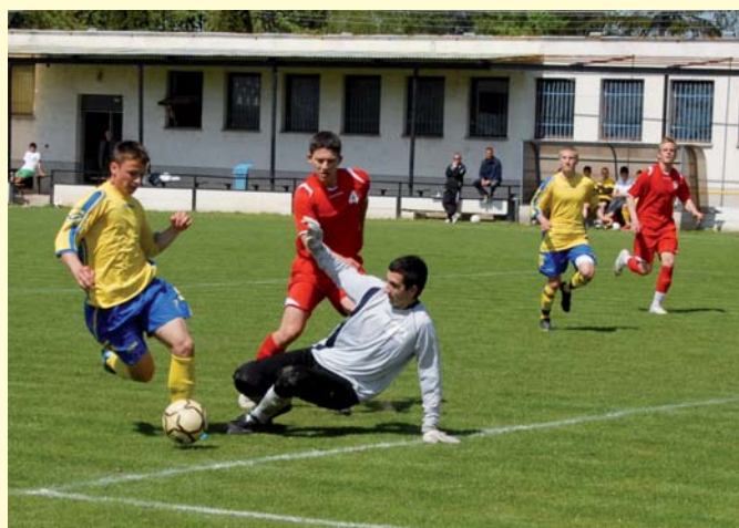
Vo futbale sa najviac darilo chlapcom z trnavského Športového gymnázia.