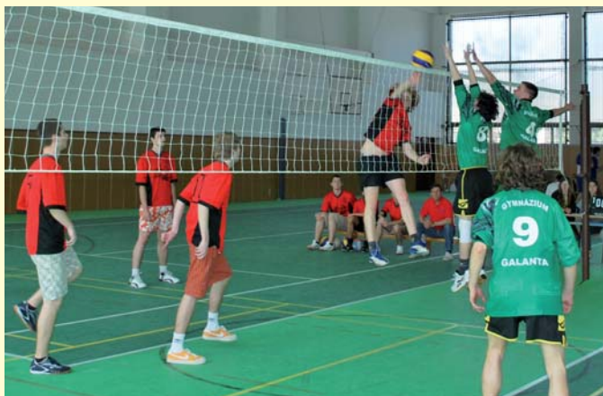
Chlapčenský volejbalový turnaj vyhrali gymnazisti z Galanty (v zelenom).