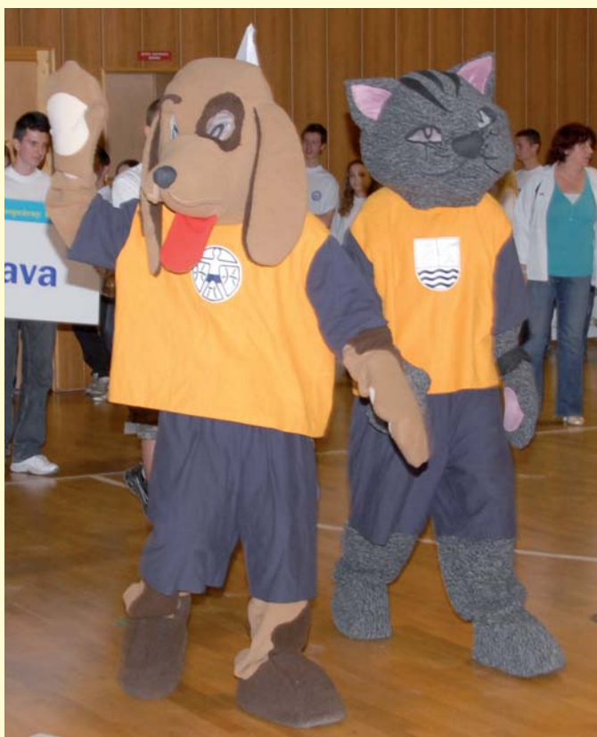
Maskoti olympiády Žmurko a Murka vzbierali príspevky pre útulok pre zvieratá.